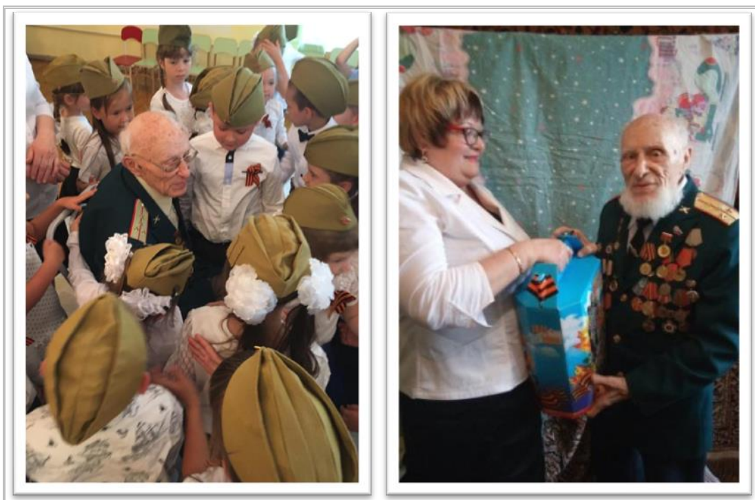
Слушаем рассказы о войне

Ни один праздник, посвященный победе в Великой Отечественной войне, не обходится без приглашения нашего дорогого и любимого ветерана. Здесь мы торжественно вручаем ему подарки, а дети с удовольствием танцуют, читают стихи на военную тематику.